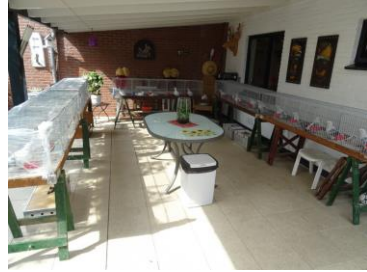
Meegebrachte duiven clubdag 2018