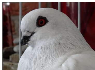
Kopstudie winnende duif