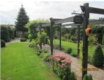
Fraai aangelegde ruime tuin Willy Lambers